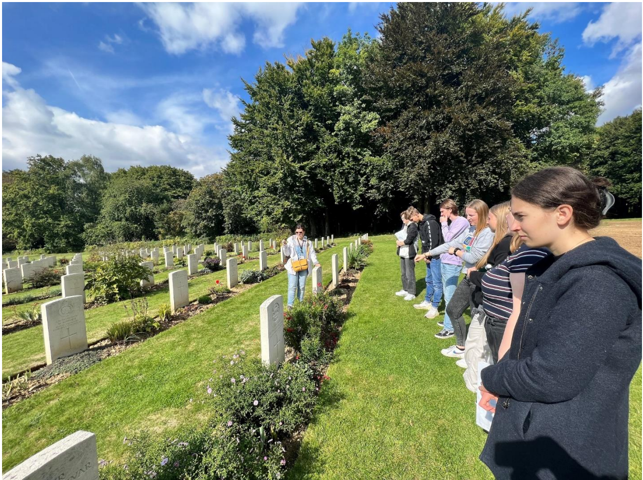
Auf dem britischen Soldatenfriedhof am Denkmal von Thiepval

Am 20. September fuhren wir von Langemark nach Péronne an der Somme, das wir nach knapp zweistündiger Busfahrt erreichten. Der erste Programmpunkt des Tages war ein Besuch des „Historial de la Grande Guerre“ im ehemaligen Schloss von Péronne. Das „Historial“ ist ein Museum und eine Forschungsstätte, das von Historikern aus Frankreich, Großbritannien und Deutschland konzipiert wurde. Besonders beeindruckend war die im Museum ausgestellte Sammlung von 50 Radierungen, die Otto Dix im Jahr 1924 unter dem Titel „Der Krieg“ anfertigte und über die wir bereits beim Abendseminar am Vortag gesprochen hatten. Am Nachmittag folgte im Rahmen des „Circuit de Mémoire“ eine Rundfahrt zu mehreren großen Gedenkstätten im Gebiet der Somme. Unter der Leitung einer sachkundigen örtlichen Führerin besuchte die Gruppe den Minenkrater Lochnagar bei La Boisselle, das britische Denkmal von Thiepval und die kanadische Gedenkstätte bei Beaumont-Hamel. Im Rahmen dieser Rundfahrt wurden mehrere größere und kleinere Soldatenfriedhöfe aufgesucht. Am Abend kehrte die Gruppe nach Langemark zurück. Nach dem Abendessen wurde dort die am Vorabend begonnene Präsentation und Diskussion über Kriegsgedichte und Kriegsgemälde fortgesetzt.