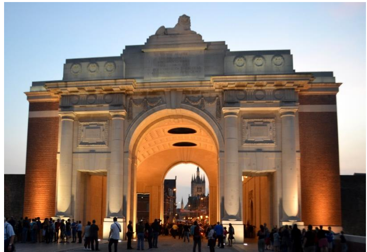
Gedenkzeremonie am Menentor

Die Studienfahrt begann am 18. September 2022. Nach der Anreise nach Langemark, wo die Teilnehmer/innen in einer Jugendherberge untergebracht waren, fuhr die Gruppe ins nahegelegene Ypern. Dort gab Prof. Müller bei einem Stadtrundgang eine kurze Einführung in die historische Entwicklung der Stadt Ypern und die Ereignisse während des Ersten Weltkriegs. Der Rundgang führte von der großen Tuchhalle im Stadtzentrum zum Menentor, von dort über die frühneuzeitlichen Wallanlagen und Kasematten bis zum südlichen Stadttor. In dessen unmittelbarer Nähe befindet sich der britische Soldatenfriedhof „Ramparts Cemetery“, dessen Besuch einen