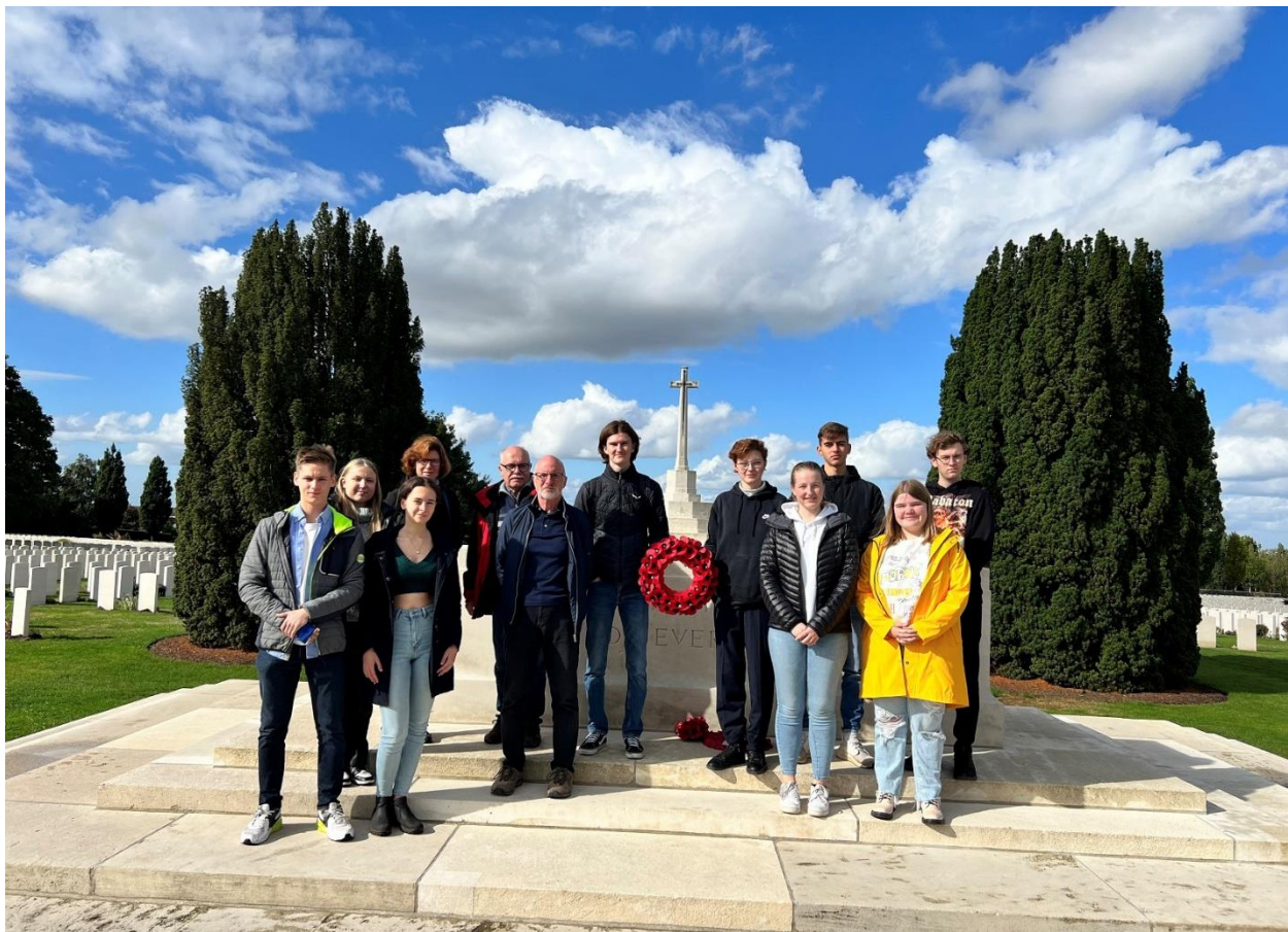
Besuch des Soldatenfriedhofs Tyne Cot

Am 19. September wurde zunächst der deutsche Soldatenfriedhof in Langemark besucht, anschließend fuhren wir zum großen britischen Soldatenfriedhof Tyne Cot bei Passchendaele. Nach einer kurzen Mittagspause wurde das Tagesprogramm fortgesetzt mit der Besichtigung der britischen Schützengräben und Unterstände, welche in den 1990er Jahren nördlich von Ypern ausgegraben wurden (Yorkshire Trenches and Dugouts). Anschließend fuhren wir ins Stadtzentrum und besuchten dort das Weltkriegsmuseum „In Flanders Fields“ in der nach dem Ersten Weltkrieg wieder aufgebauten großen Tuchhalle. Am Abend fand nach dem gemeinsamen Essen in der Jugendherberge in Langemark ein Seminar statt, bei dem einige Schüler/innen über die im Ersten Weltkrieg weitverbreitete Kriegsdichtung und die Verarbeitung der Kriegserfahrungen in der bildenden Kunst referierten. Die Schüler/innen stellten der Gruppe einige Beispiele von britischen und deutschen Autoren vor, über die anschließend ausgiebig diskutiert wurde.